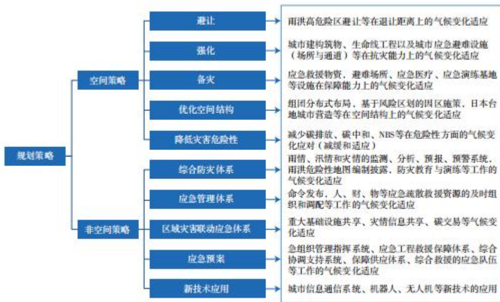
Fig.3 Stratégies de gestion résiliente des risques d'inondation dans le contexte du changement climatique

affecte à la fois la fréquence, l'échelle et l'intensité des inondations dues aux eaux pluviales et la distribution spatiale et temporelle de ces inondations, affecte ainsi directement ou indirectement le développement de stratégies spatiales et non spatiales (Figure 3 ). Les stratégies spatiales, basées sur leur relation avec le risque d'inondation par les eaux pluviales, peuvent être classées en stratégies d'évitement, d'intensification, de préparation, d'optimisation de la structure spatiale et d'atténuation des risques. L'évitement fait référence à l'éloignement des zones à risque d'inondation par les eaux pluviales telles que les plaines inondables des rivières, les plaines inondables et les plaines inondables. Le renforcement fait référence à la construction de structures plus susceptibles d'être menacées par les inondations par les eaux pluviales.